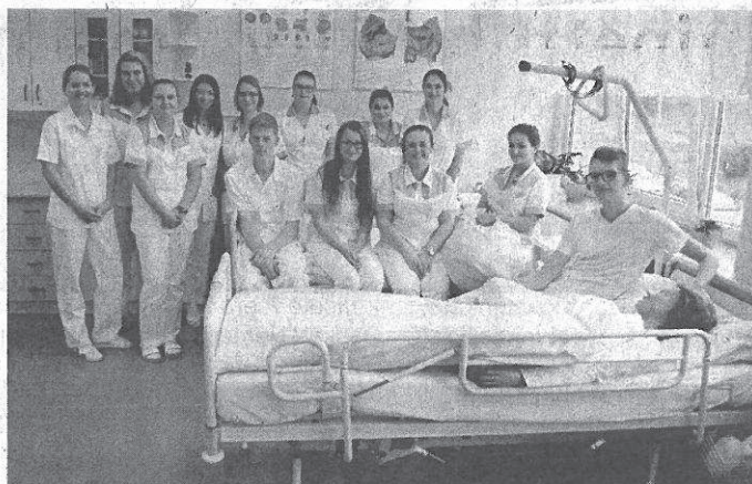
Studenti 4. ročníku oboru Zdravotnický asistent s třídní učitelkou a práce s novým systémem.

Iniciátorkou projektu zavedení nemocničního programu do školního prostředí